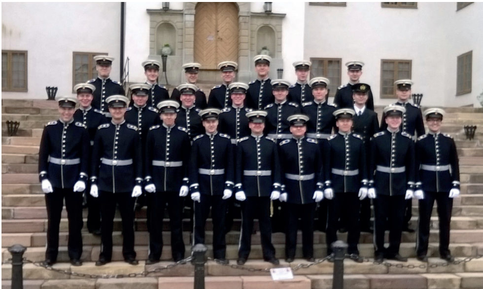
Kadettikuoro.