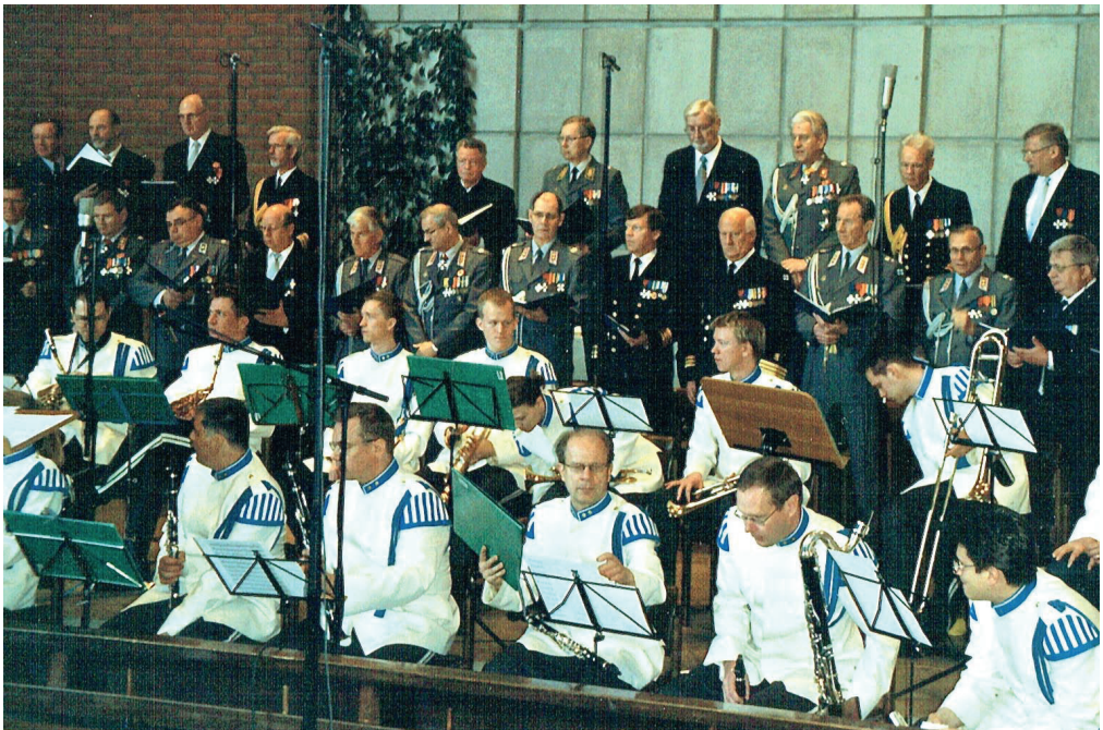
Kuvausta varten juhla-asuihin pukeutuneet kuoro ja soittokunta huokaisevat ottojen välissä.

Haapaniemen sotakoulu perustettiin eversti Yrjö Maunu Sprengtportenin suunnitelman pohjalta. Sen mukaan Ruotsin kuningas Kustaa III määräsi 23.7.1779 päivätyssä kirjelmässä sotakoulun perustettavaksi ja sijoitettavaksi väliaikaisesti Kuopioon. Sieltä koulu siirtyi runsaan vuoden kuluttua Haapaniemeen, jossa nuoret kadetit saivat rauhassa keskittyä opiskeluun. Tuon ajan pukuohjeessa Haapaniemen kadetilta vaadittiin juhlapuvussa puuteroitua tukkaa kiharoineen.