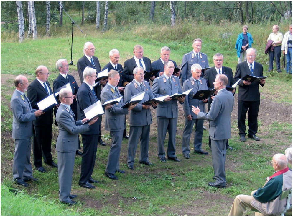
Krimin sodan 150 vuotismuistotilaisuus Lauttasaaren valleilla v.2005 (Kuva Kaaderilaulajien 20 v historiakirjasta)

Vuonna 1912 Viipurin Lauluveikot (Wiborgs Sångarbröder) järjesti sävellyskilpailun. Saapuneilla uusilla lauluilla pyrittiin juhlistamaan viiden vuoden kuluttua kuoron 20 vuotista taivalta. Määräaikaan mennessä jätettiin 14 sävellystä, joiden laatu ei vastannut odotuksia. Niinpä käännyttiin suoraan tunnettujen säveltäjien puoleen ja pyydettiin heiltä uusia mieskuorolauluja. Leevi Madetojan Kaunehin maa , jonka hän sävelsi 1916 Bertel Gripenbergin ruotsinkieliseen runoon Det skönaste landet , oli yksi näistä juhluvuoden lauluista. Kuoron 20 vuotisjuhlat jäivät kuitenkin pitämättä syttyneen vapaussodan takia.