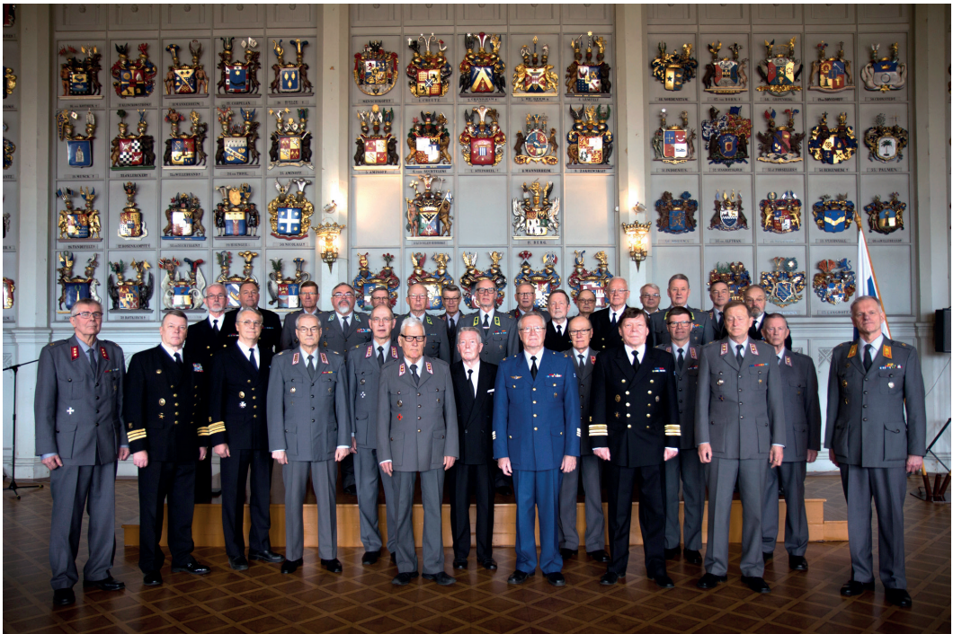
Kaaderilaulajat kevätkonsertissa v. 2016