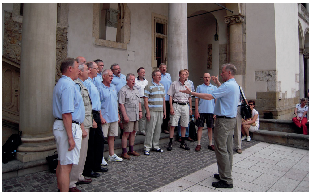
Kesäpaidat päällä Wawellin linnan pihalla Krakovassa 18.6.2011