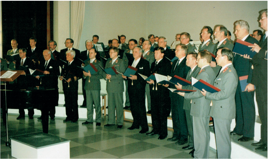
Kuoron ensikonsertti Maanpuolustuskorkeakoulun juhlasalissa 22.3.1995