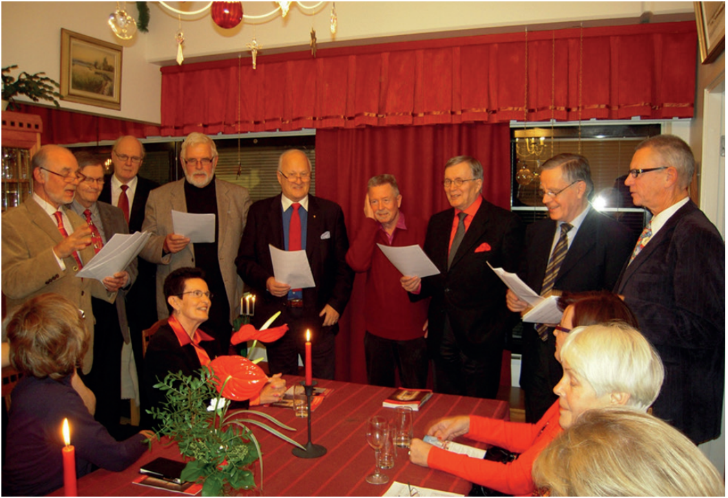
Toivon Tähtöset viettämässä Tuomaan päivää 21.12.2009