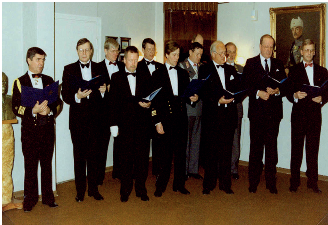
Kadettikurssin 48-33-48 kuoro 30-vuotiskurssijuhlassa Mikkelin Upseerikerholla syksyllä 1993

kaikille kadettikuorossa laulaneille. Kenraaliharjoitus pidettiin sitten Mikkelissä ennen kurssijuhlaa. Kuoron esiintyminen sujui mallikkaasti ja saimme raikuvat aplodit erityisesti paikalla olleilta daameilta.