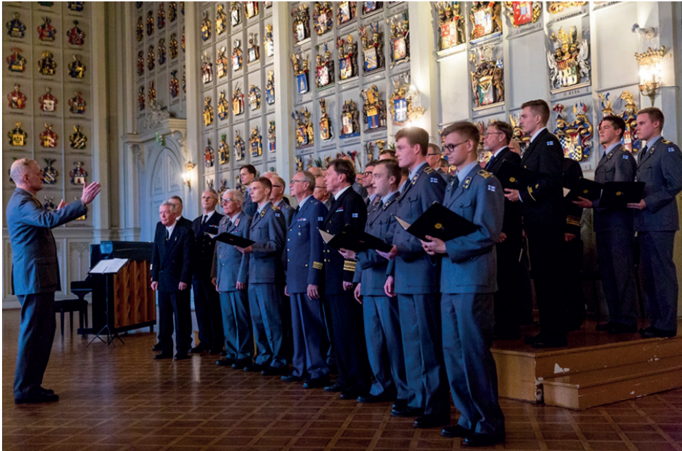
Kaaderilaulajat ja kadetit 25 vuotis- juhlakonsertissa Ritarihuoneella vuonna 2019

Olisiko ratkaisu löydettävissä siitä, että jotkin nuoremmat kadettikurssit ottaisivat kunnia-asiakseen vaalia kuoroperinnettä ja Kaaderilaulajien toiminnan jatko olisi turvattu. Oma kadettikurssimme tarttui aikoinaan ”härkää sarvista” ja saatiin Kaaderilaulajat synnytettyä. Parhaimmillaan kuorossa lauloi yli kolmekymmentä upseeria kadetista kenraaliin. Löytyisikö vielä tahtoa ja kykyä saattaa sotilaslaulujen esitykset kunniaan upseerin elämässä?