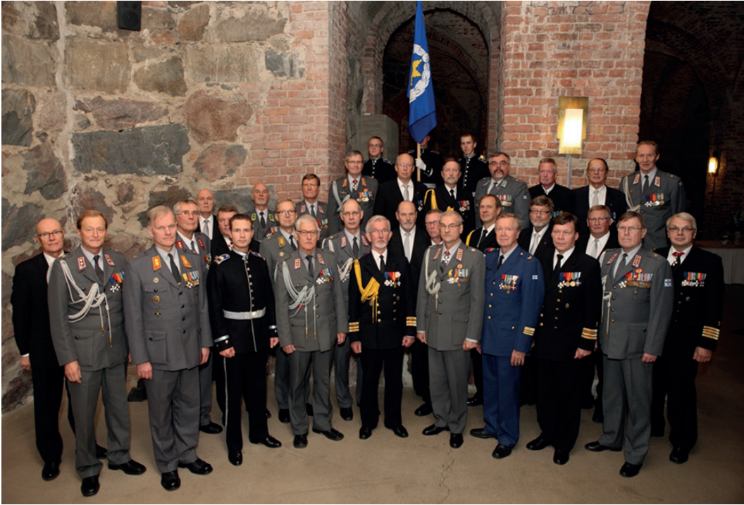
Kaaderilaulajien lipunnaulaustilaisuus Helsingin Tuomiokirkon kryptassa 14.9.2009

Kaaderilaulajien perustamisen jälkeen Toivon Tähtöset jatkoi omaa menestyksestä toimintaansa vuosikausia. Toimintaperiaatteet pysyivät pitkälti samoina. Tarjoilun osalta päätettiin jossakin vaiheessa, ettei aterioita ”konserttien” yhteydessä enää tarjota, vaan tyydytään kahvituslinjaan. Kun korona pandemia sitten iski, pysäytti se myös Toivon Tähtösten toiminnan lähes kokonaan. Ei ollut enää mahdollisuuksia kokoontua. Yhtye vietti hiljaiseloa pari vuotta. Pandemian helitettyä yritimme käynnistää toiminnan uudelleen. Se ei ole ollut helppoa. Olihan laulajien keski-ikäkin jo yli 80 vuotta. Muutama tapaaminen on voitu järjestää ja ehkä vielä löytyy tarmoa toiminnan jatkamiselle. Aika on pikkuhiljaa tehnyt tehtävänsä. Osa laulajista on jo siirtynyt taivaalliseen kuoroon ja osa daameista matkannut ajasta ikuisuuteen. Tulevaisuus näyttää, onko Toivon Tähtösillä vielä jotakin annettavaa.